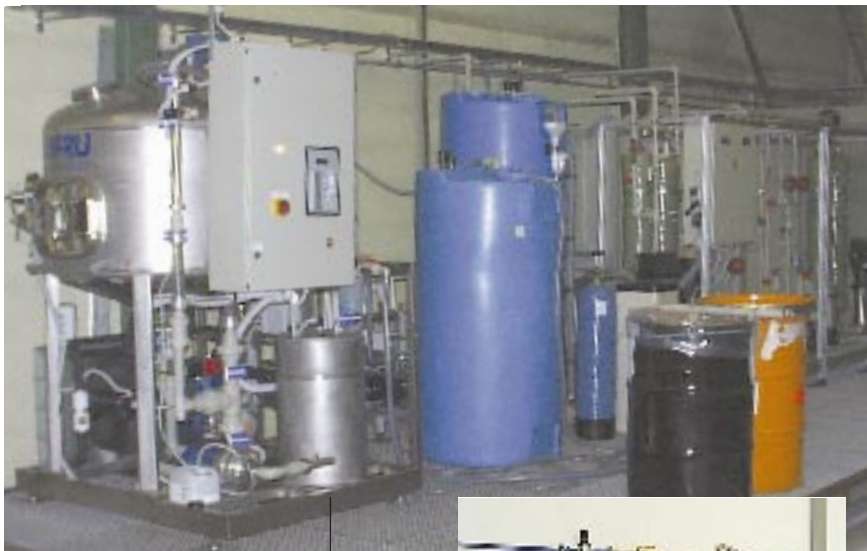
Bild 2: Vakuumverdampfer WSC-500. Die Anlage hat einen Durchsatz von 22 l/h.

den Dauereinsatz im 24-Stunden-Betrieb geeignet.