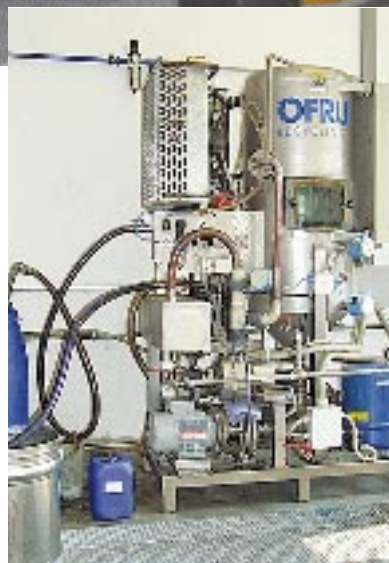
Bild 3: Die Vakuumverdampfungsanlage WSC-700 ist für größere Destillationsmengen ausgelegt. Ihr Durchsatz liegt bei 32 l/h.

Eine typische Aufbereitungsmethode ist die chemisch-physikalische Behandlung. Diese beinhaltet folgende Schritte: