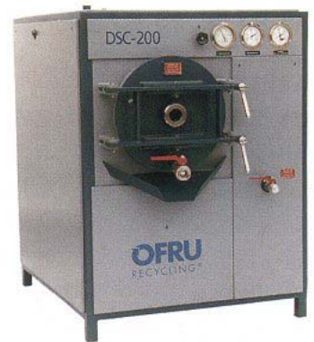
DSC 系列溶剂回收装置

在德国,安装小型净化回收设备是不要求申请报批的,只要出示告示即可。因地域不同,所属的主管部门也不相同,一般需要通知行业安检部门。